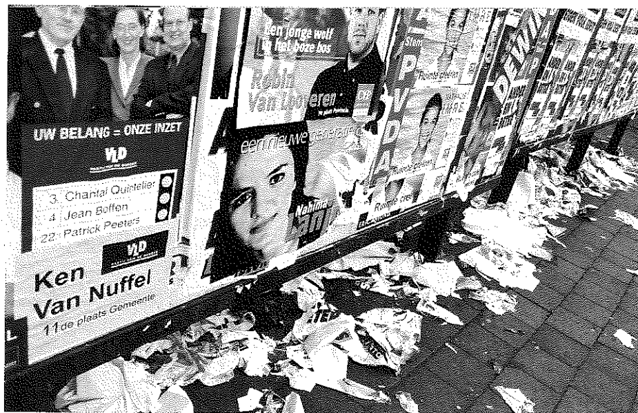
Ook al stonden er in 2000 al 39 procent vrouwen op de lijsten, toch werd maar 29 procent vrouwen verkozen.

Petra Meier is ook gaan kijken naar de rits op de eerste twee plaatsen: 'Dan zie je dat bijvoorbeeld VU-ID dat maar 24 procent vrouwelijke lijsttrekkers had, op 72 procent van de lijsten wel een man en een vrouw op de twee eerste plaatsen had. In 2000 wilde die partij echt investeren in vrouwen, maar uiteindelijk kwamen vrouwen toch op de tweede plaats terecht. Agalev speelde de rits op 84 procent van de lijsten, bij de CVP en Vivant was dat 56 procent, bij de SP 55 procent, de VLD 43 procent en het Vlaams Blok 34 procent.' Perfecte ritsen over de gehele lijst kwamen in 2000 eerder zelden voor: