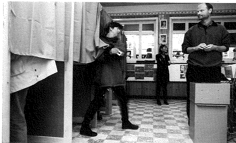
Vrouwen krijgen veel minder voorkeurstemmen dan mannen.

Ook Petra Meier vindt dit een klassieke taakverdeling. 'Maar welzijn, dat met vrouwen wordt geassocieerd, gaat ge-